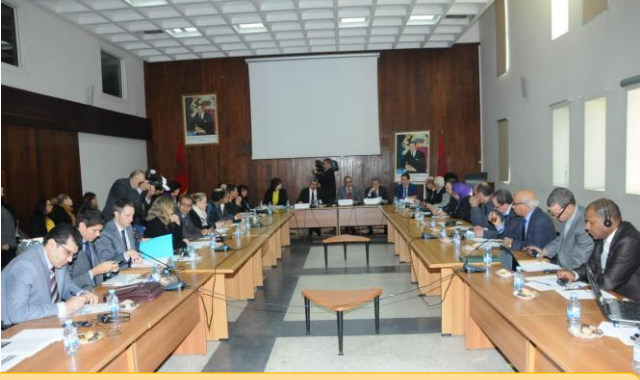
الجلسة الافتتاحية للورشة الدولية حول موضوع " جودة خدمات المرافق العمومية"

نظمت اللجنة المتوسطة التابعة لمنظمة المدن والحكومات المحلية المتحدة، بشراكة مع المركز الوطني للوظيفة العمومية الترابية الفرنسية CNFPT، وبتعاون مع مجلس جهة الرباط سلا القنيطرة، ورشة عمل دولية 2015 حول موضوع " جودة خدمات المرافق العمومية" وذلك بمقر الجهة.