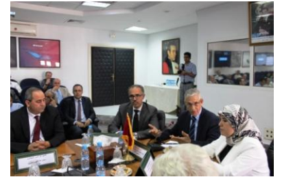
مراسيم التوقيع بمقر وزارة التعليم العالي